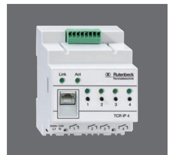
TCR IP 4 700 802 610 REG-Gehäuse 4 TE; lichtgrau (ähnlich RAL 7035); 72 x 90 x 65 mm; 298 g