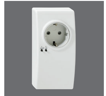
TC IP 1 700 902 610 reinweiß (ähnlich RAL 9010); 66 x 136 x 76 mm; 170 g