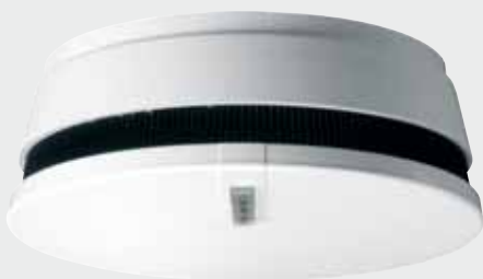
Rauchwarnmelder VdS, reinweiß (A)

Qualifiziert für Qualm: Rauchwarnmelder VdS