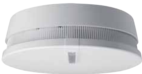
Wärmewarntmelder, reinweiß (A)